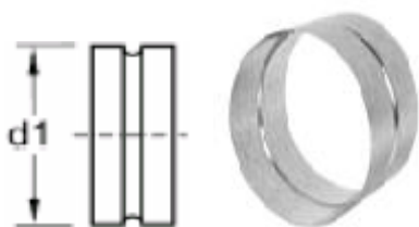
nypie wymiar w minusie